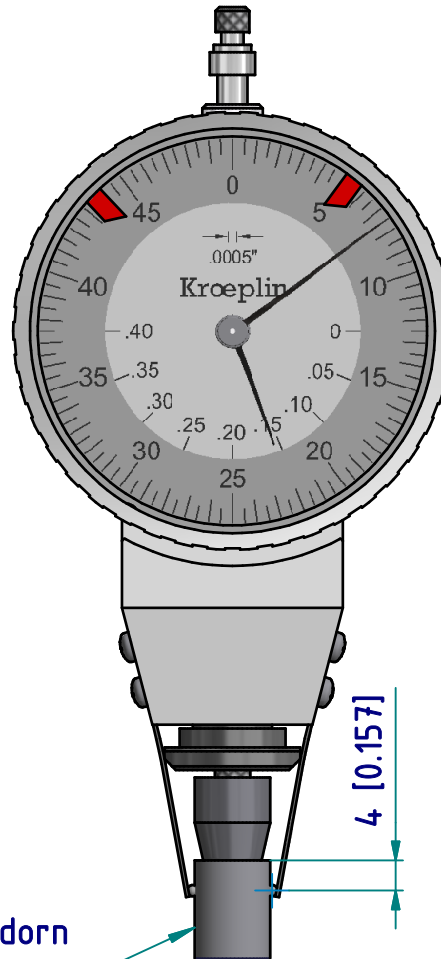
Kalibrierdorn (im Lieferumfang enthalten)